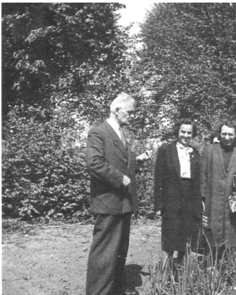
Profesor ze studentami podczas zajęć w Miejskim Ogrodzie Botanicznym w Łodzi (1951)

W czasie pobytu w Łodzi pełnił funkcję przewodniczącego Zespołu Farmaceutycznego Rady Naukowej Ministerstwa Oświaty (1946-1952), rzeczoznawcy naukowego Centralnej Komisji Kwalifikacyjnej dla Pracowników Nauki (1953-1957) oraz był członkiem Komitetu Nauk Medycznych Polskiej Akademii